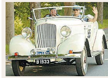
Ein Plymouth-Roadster aus dem Jahre 1933.