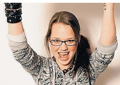
Stefanie Heinzmann kommt nach Saarbrücken.

Elf Live-Bands, darunter The Rasmus aus Finnland, die Schweizerin Stefanie Heinzmann und Cassandra Steen treten am 10. Juli bei dem Gratis-Festival zum Sommerferienbeginn auf dem Saarbrücker Halberg auf.